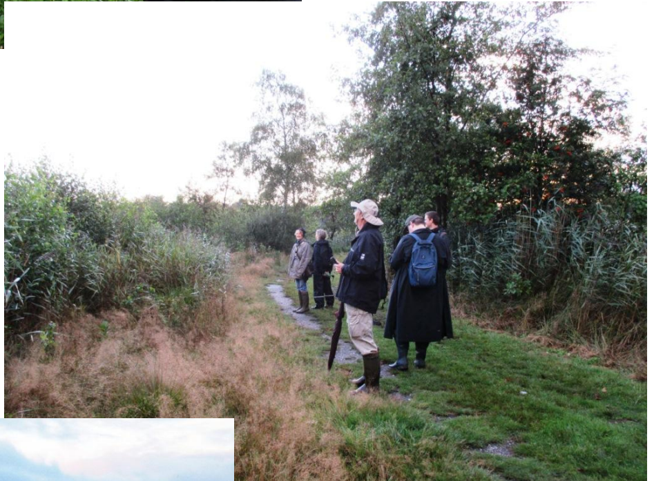
wat hangt daar in de lucht