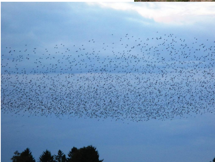
enkele spreeuwen !